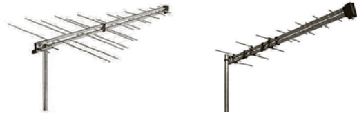
Algeng tegund UHF greiðu.

Loftnetin fást hjá raftækja- og loftnetsverslunum.